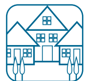
Desarrollos de vivienda